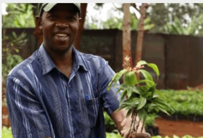
Scelta alberi da piantare fatta insieme ai contadini