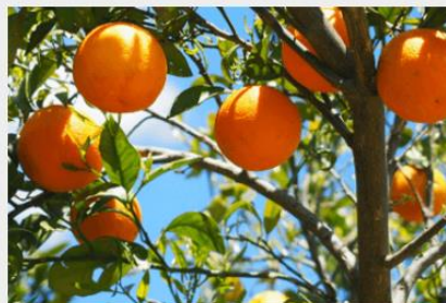
Copertura costi fino a fase produttiva albero