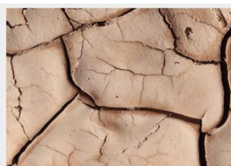
Contrasto erosione del suolo e desertificazione