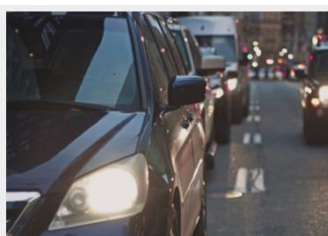
Assorbimento CO 2 a livello globale

Piantare alberi è un lavoro complesso. Non solo da un punto di vista tecnico - servono infatti competenze e risorse per creare luoghi adatti a far germinare e crescere i piccoli alberi - ma anche e soprattutto da un punto di vista strategico. Piantare alberi non basta, vanno accompagnati nella crescita. Questo significa ragionare sul medio e lungo periodo e per questo è necessario individuare l'albero giusto per il posto giusto e lo scopo giusto. Il progetto che stiamo realizzando in per la piantumazione dei nostri alberi risponde esattamente a queste necessità.