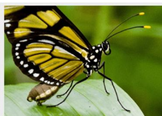
Tutela della biodiversità