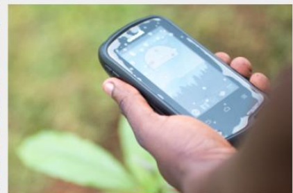
Formazione e opportunità di reddito